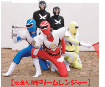
【安全戦隊ドリームレンジャー】